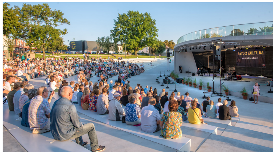
Dawną muszlę koncertową, choć wzbudzała sentyment, trudno było uznać za ładny i funkcjonalny obiekt. Nowy amfiteatr, który w zbliżającej się kadencji chcemy zadaszyć, zdobył już dwie prestiżowe nagrody architektoniczne