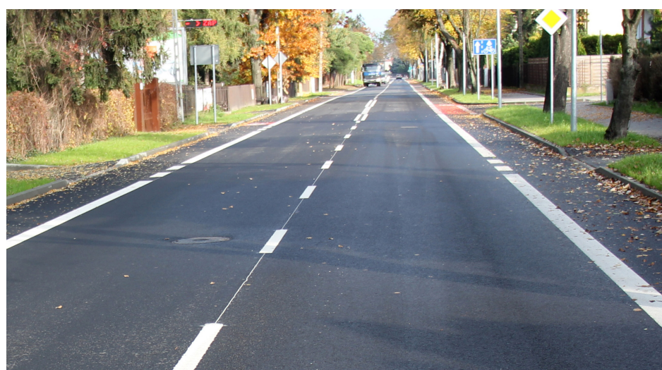
Miejski odcinek ulicy 15 Sierpnia przed remontem | 15 Sierpnia po przebudowie, z nowymi chodnikami i ścieżkami rowerowymi