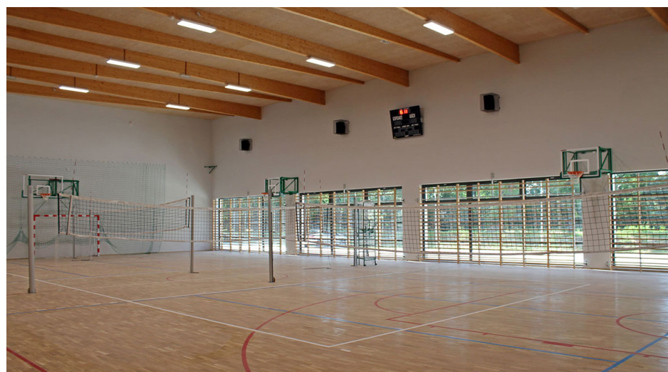
Boryszewska „dwójka” ma nowoczesną halę sportową. Na jej budowę pozyskaliśmy prawie milion złotych dofinansowania z Ministerstwa Sportu