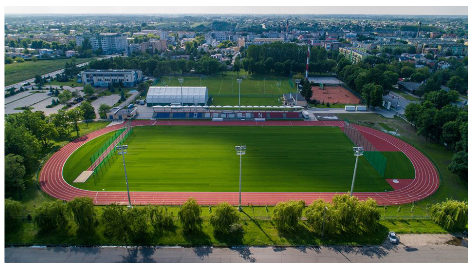
Orkan dawniej i dziś to dwa różne światy. Zbudowaliśmy zadaszoną trybunę, bieżnię lekkoatletyczną, renowacji poddana została płyta główna, a całość oświetla nowoczesny system lamp. Powstaną jeszcze dwa budynki klubowe, korty tenisowe, a dwa boiska boczne zyskają nową nawierzchnię - jedno sztuczną, drugie naturalną